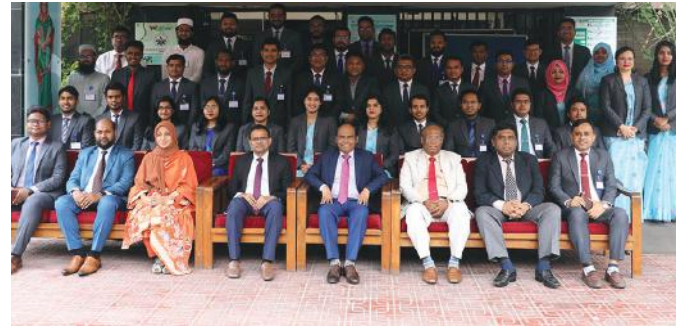
Development Administration for BCS (Admin) Cadre Officers (4 th Batch) -শীর্ষক প্রশিক্ষণ কোর্সের গ্রুপ ছবি।