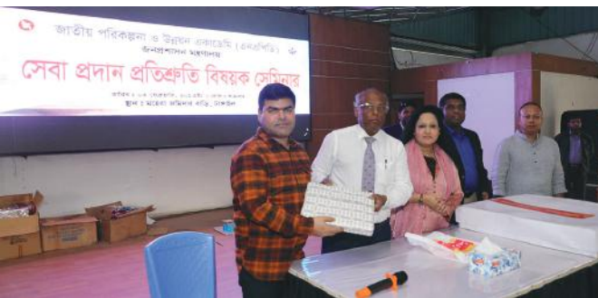
জাতীয় পরিকল্পনা ও উন্নয়ন একাডেমি কর্তৃক “টাস্সাইল জেলার মির্জাপুরে অবস্থিত ঐতিহাসিক মহেরা জমিদার বাড়িতে” আয়োজিত গত ৩ ফেব্রুয়ারি, ২০২৩ তারিখ সেবা প্রদান প্রতিশ্রুতি বিষয়ক সেমিনার অনুষ্ঠিত হয়। অনুষ্ঠানে একাডেমির সকল পর্যায়ের কর্মকর্তা-কর্মচারী পরিবারের লোকজনসহ উপস্থিত ছিলেন।